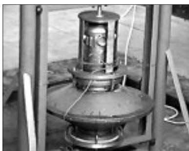
Рис. 1. Измерительная установка с закрепленным в ней на магнитной опоре гравитационным двигателем

Многолетние экспериментальные проверки этих уравнений подтвердили их справедливость, в том числе при описании механизма магнитострикции как вторичного гравитационного эффекта в диапазоне подмагничивающих полей 0 \ll H_0 \ll H_{\text{насыщ}} ; эффекта смещения частоты оптического излучения (красное и синее смещение); искривления оптического луча в неоднородно намагниченном сегнетоэлект-